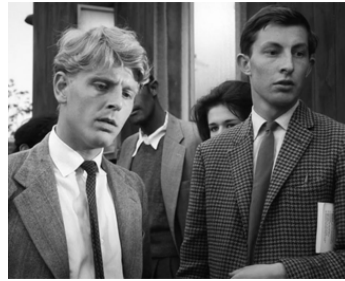
1963 AU BORD DU GOUFFRE (The Mind Benders) de Basil Dearden avec Terence Alexander