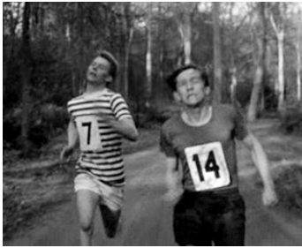
1962 LA SOLITUDE DU COUREUR DE FOND de Tony Richardson avec Tom Courtenay