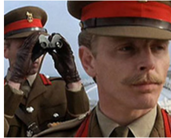
1969 AH, DIEU QUE LA GUERRE EST JOLIE (Oh! what a lovely war) de R. Attenborough