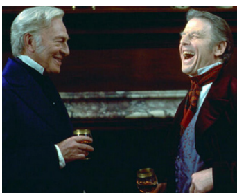
2002 NICHOLAS NICKLEBY (Nicholas Nickleby) de Douglas McGrath avec Christopher Plummer