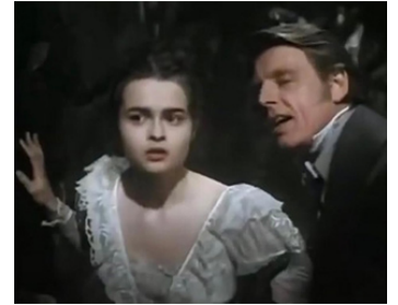
1987 LES HASARDS DE L'AMOUR (A Hazard of Hearts) de John Hough avec H. Bonham-Carter