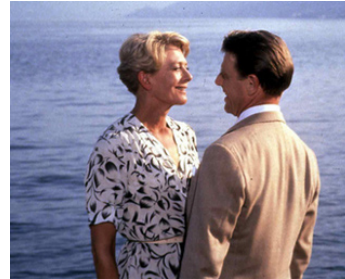
1995 ROMANCE SUR LE LAC (A Month by the Lake) de John Irvin avec Vanessa Redgrave