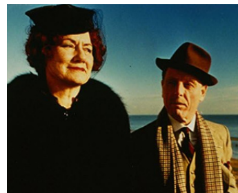
1997 A DANCE TO THE MUSIC OF TIME de Christopher Morahan avec Gillian Barge