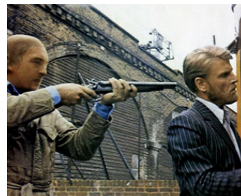
1977 LE PIÈGE INFERNAL (The Squeeze) de Michael Apted avec David Hemmings