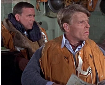
1969 LA BATAILLE D'ANGLETERRE (Battle of Britain) de Guy Hamilton