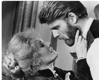
1973 MAISON DE POUPEE (A Doll's House) de Joseph Losey avec Delphine Seyrig