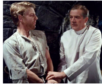
1966 THE FROZEN DEAD d'Herbert J. Leder avec Dana Andrews