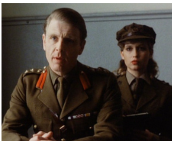
1977 LE CHOIX DU DESTIN (Soldaat van Oranje) de Paul Verhoeven