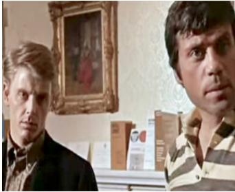
1967 I'LL NEVER FORGET WHAT'S 'ISNAME de Michael Winner avec Oliver Reed