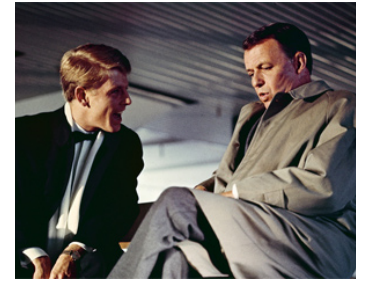
1967 CHANTAGE AU MEURTRE (The Naked Runner) de Sidney J. Furie avec Frank Sinatra