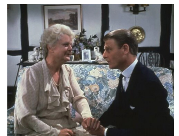
1980 LE MIROIR SE BRISA (The Mirror crack'd) de Guy Hamilton avec Angela Lansbury