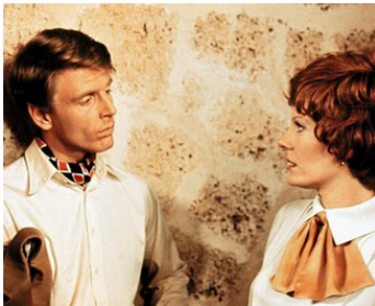
1973 CHACAL (The Day of the Jackal) de Fred Zinnemann avec Delphine Seyrig