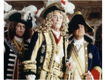
1996 LES VOYAGES DE GULLIVER (Gulliver's Travels) de Ch. Sturridge avec Peter O'Toole