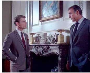
1983 JAMAIS PLUS JAMAIS (Never say never again) d'Irvin Kershner avec Sean Connery