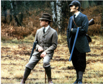
1985 LA PARTIE DE CHASSE (The Shooting Party) d'Alan Bridges avec John J. Carney