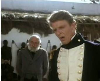
1987 SHAKA ZULU (Shaka Zulu) de William C. Faure et Joshua Sinclair avec Trevor Howard