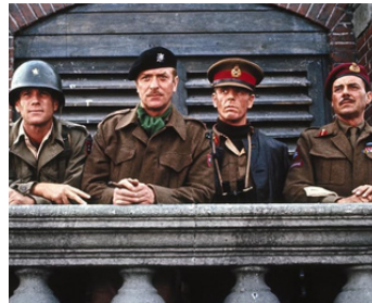
1977 UN PONT TROP LOIN (A Bridge too far) de R. Attenborough avec M. Caine, D. Bogarde