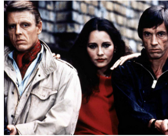
1985 LES OIES SAUVAGES 2 (Wild Geese II) de Peter R. Hunt avec B. Carrera, Scott Glenn