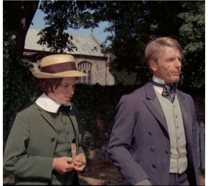
1970 LE MESSENGER (The Go-Between) de Joseph Losey avec Dominic Guard