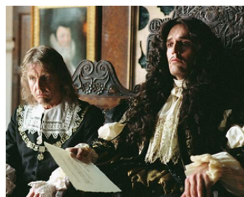
2004 STAGE BEAUTY (Stage Beauty) de Richard Eyre avec Rupert Everett