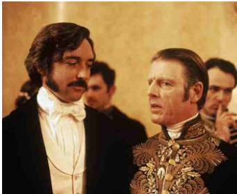
1991 LA DYNASTIE DES STRAUSS (The Strauss Dynasty) de M. Chomsky avec Anthony Higgins