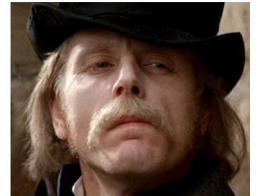
1977 LES DUELLISTES (The Duellists) de Ridley Scott