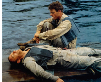
1989 RETOUR DE LA RIVIÈRE KWAI (Return from the River Kwai) d'A. McLaglen avec Nick Tate