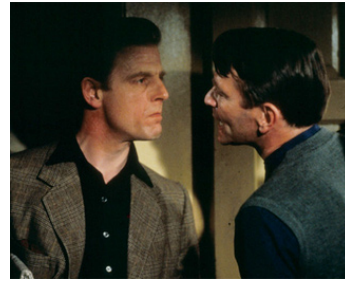
1983 L'HABILLEUR (The Dresser) de Peter Yates avec Tom Courtenay