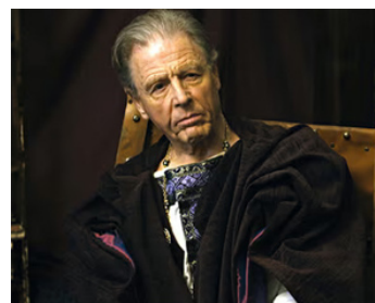
2014 DÉCLIN D'UN EMPIRE (Decline of an Empire) de Michael Redwood