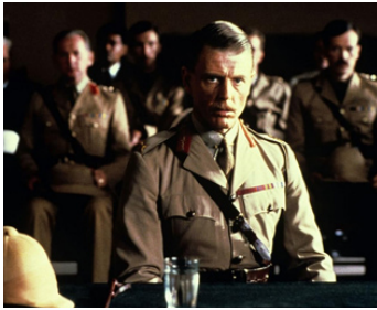
1982 GANDHI (Gandhi) de Richard Attenborough