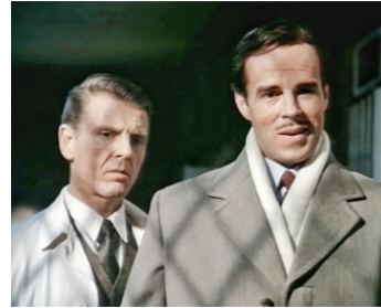
1986 LE MYSTÈRE D'ANASTASIA (Anastasia) de Marvin J. Chomsky avec Jan Niklas