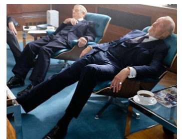
2018 JOHNNY ENGLISH CONTRE-ATTAQUE (Johnny English strikes again) de D. Kerr avec Charles Dance