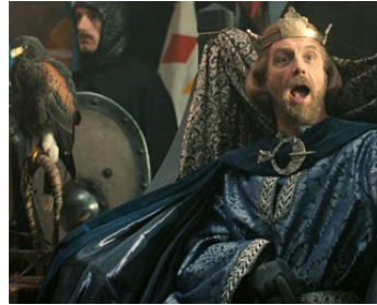
1991 ROBIN DES BOIS (Robin Hood) de John Irvin