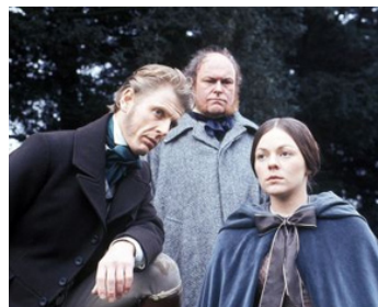
1977 LES TEMPS DIFFICILES (Hard Times) de John Irvin avec Timothy West, J. Tong