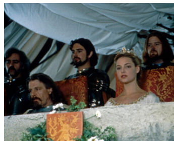
1997 PRINCE VAILLANT (Prince Valiant) d'Anthony Hickox avec Catherine Heigl