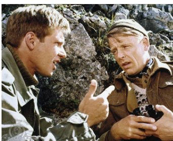
1978 L'OURAGAN VIENT DE NAVARONE (Force 10 from Navarone) de G. Hamilton avec Harrison Ford