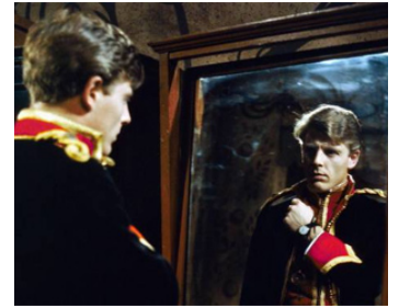
1984 LE BOUNTY (The Bounty) de Roger Donaldson