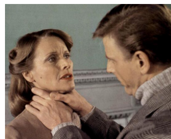
1979 LE CHAT ET LE CANARI (The Cat and the Canary) de R. Metzger avec Honor Blackman